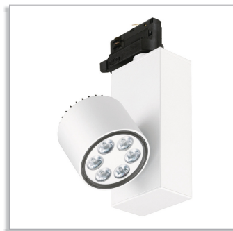
TurnRound spotlight BRG394 downlight luminaire